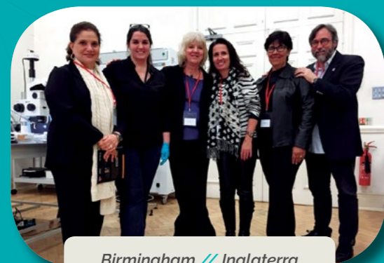
Birmingham // Inglaterra

Visitou a Escola de Joalheria e o Centro de Inovação da Universidade de Birmingham para conhecer o processo de produção de joias em metal precioso a partir da prototipagem rápida, desenvolvido em parceria com a indústria local. O grupo também foi a empresas do setor.